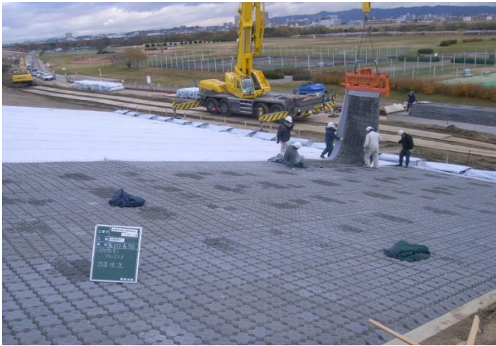
ブロックマット敷設